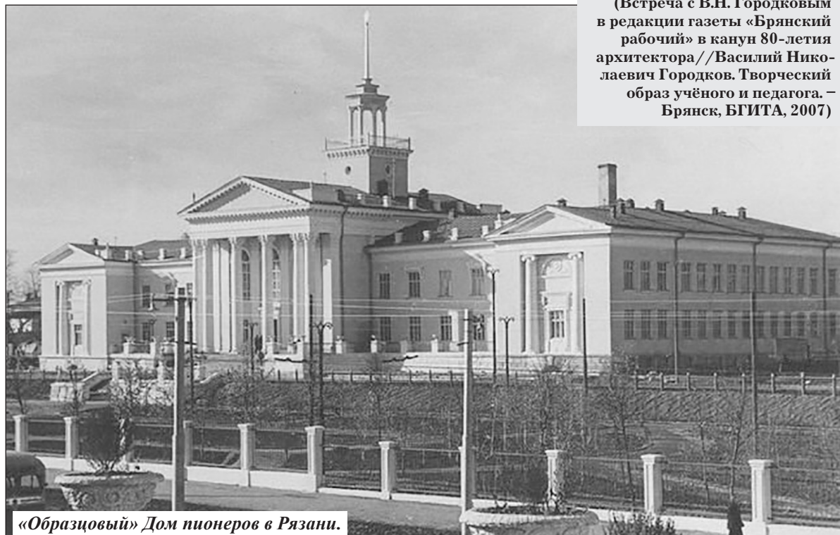
«Образцовый» Дом пионеров в Рязани.