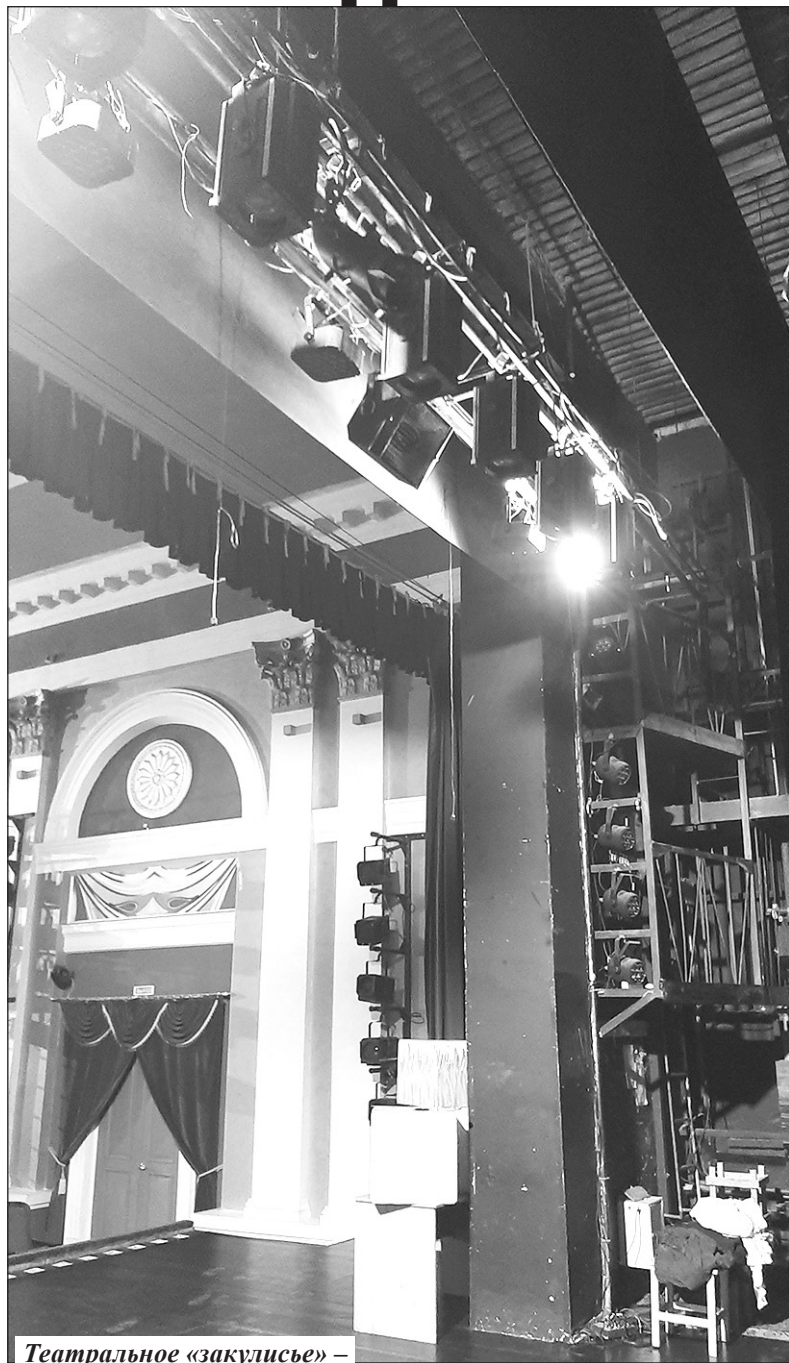
Театральное «закулисье» — часть сцены, гримерка.