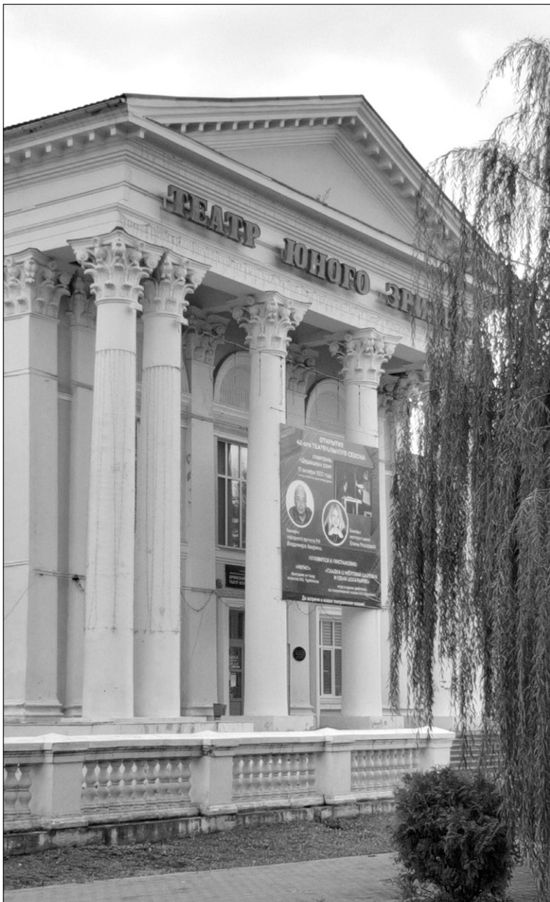
Фасад театра юного зрителя.

Брянский ТЮЗ ждёт новое будущее. На средства федерального и областного бюджетов в рамках национального проекта «Культура» здание театра юного зрителя будет полностью реконструировано. В нынешнем, 2022 году завершится проектная работа по реконструкции здания областного ТЮЗа. Заказчик – ГКУ «Управление капитального строительства Брянской области» – заканчивает все подготовительные процедуры, готовит документы для проведения экспертиз, и за дело берутся подрядчики.